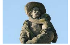
Muestra de los Carismas en la Santa Caridad