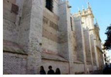
Actividades de Pastoral Familiar