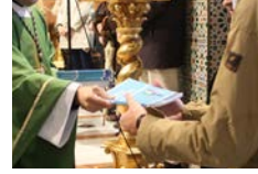
Comienza la Misión Cofrade